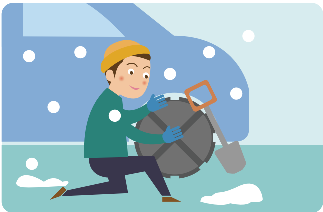
스노체인, 염화칼슘, 삽 등 자동차 월동용품을 준비합니다.