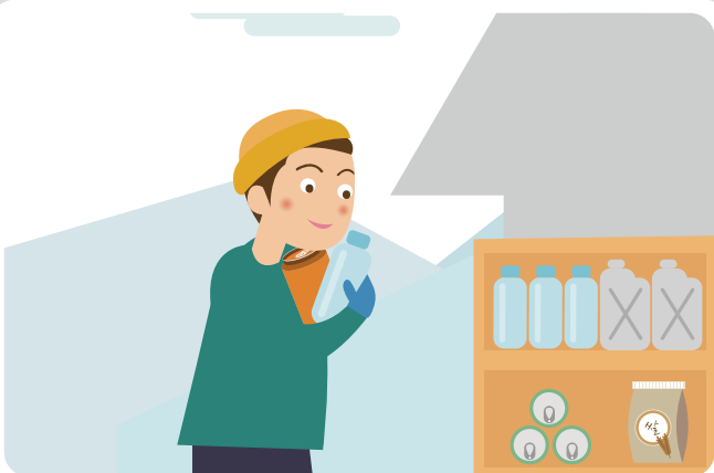
산간 고립 우려 지역에서는 식량, 연료 등 비상용품을 준비합니다.