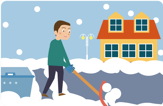
내 집 앞 눈을 수시로 치웁니다.