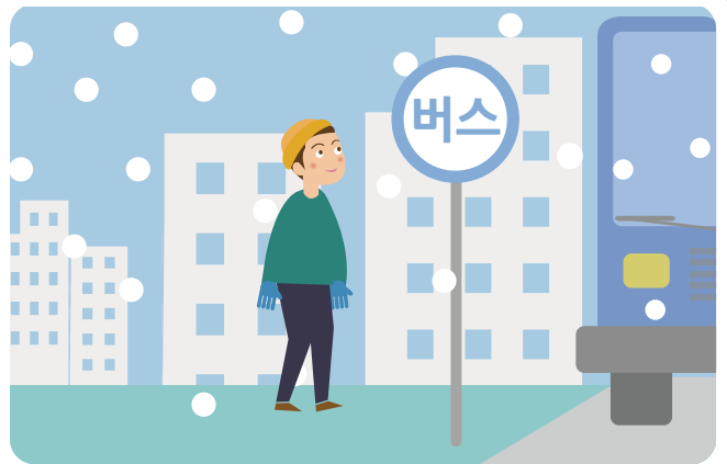
개인 차량 이용을 줄이고, 대중교통을 이용합니다.